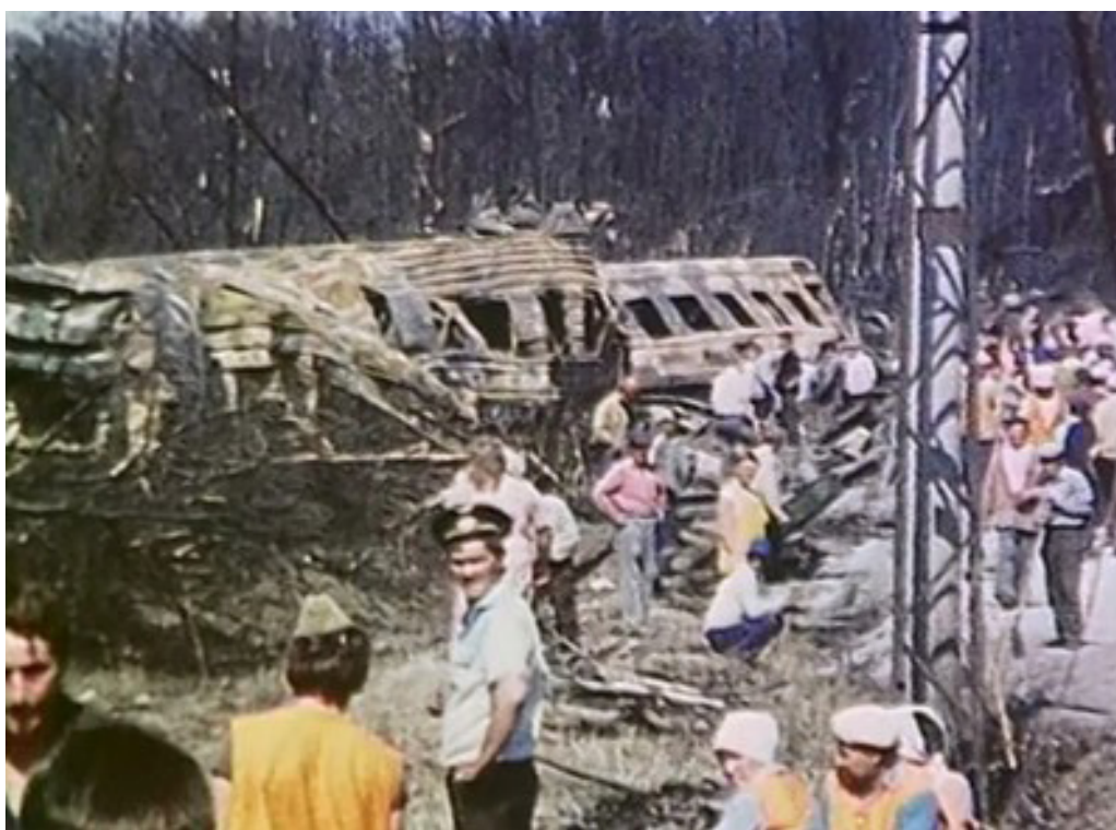
Сн. 1. Взривната вълна изхвърля част от вагоните в гората край релсите

Според различни оценки взривяването на газо-въздушната смес има характер на обемен взрив с мощност около 10-12 килотона ТНТ, което е сравнимо с мощността на ядрения взрив в Хирошима. Експлозията е толкова силна, че според някои сведения е задействан сигнала за тревога на противовъздушната отбрана на североамери-