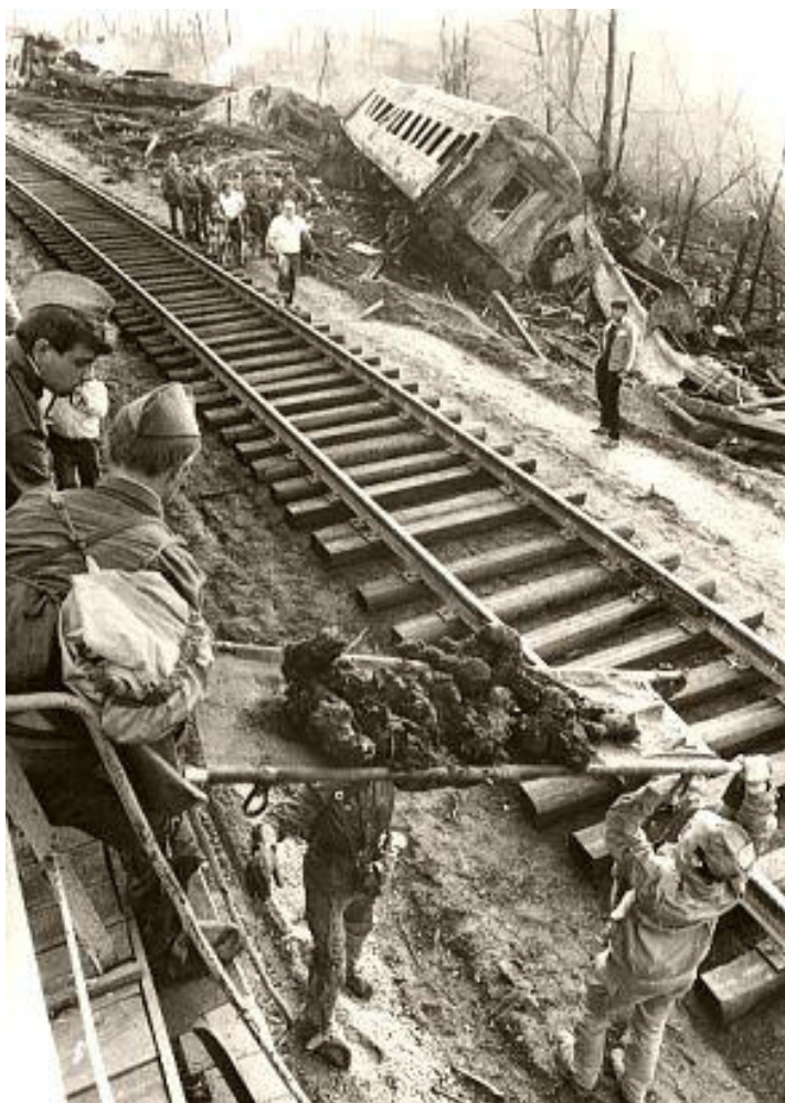
Сн. 2 Част от трасето след инцидента

Ръководството на Министерството на нефтената промишленост обаче сменя предназначението на вече почти готовия петролопровод в продуктив (га-