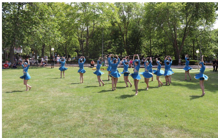
МПО "МЛАД ОГНЕБОРЕЦ" АЛБЕНА 2023

В комплексното класиране купата спечели отрядът на IX ОУ „Панайот Волов“, гр. Шумен. Младите огнеборци от СУ „Никола Вапцаров“, гр. Айтос взеха сребърните медали. Трето място зае отрядът от СУ „Васил Левски“, гр. Троян.