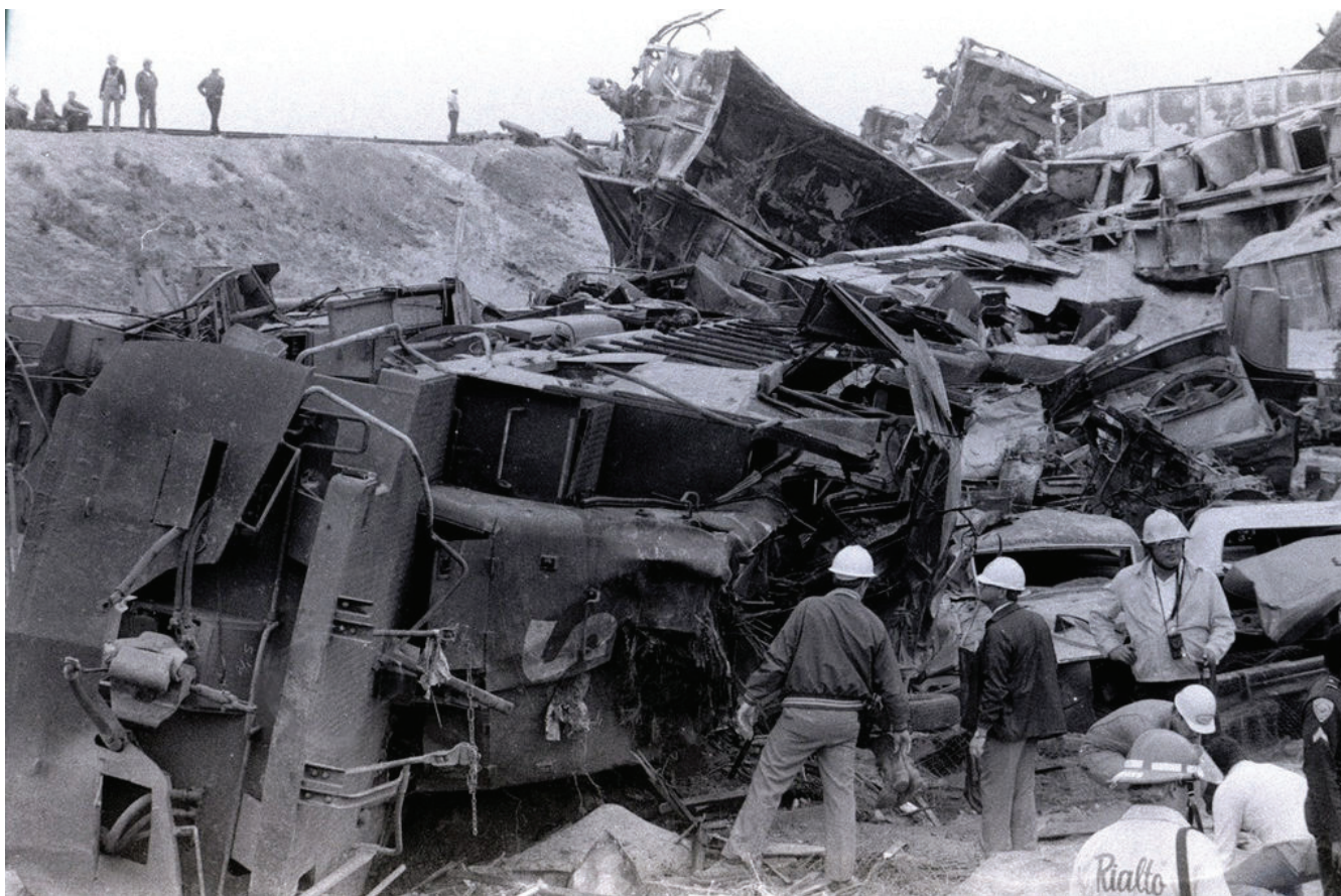
Сн. 1 Районът на инцидента

В 07.37 часа движещата се със скорост над 150 km/h жп композиция, навлиза в десен завой с ограничение на скоростта до 56 km/h, дерайлира и връхлита в намиращия се до релсите жилищен квартал.