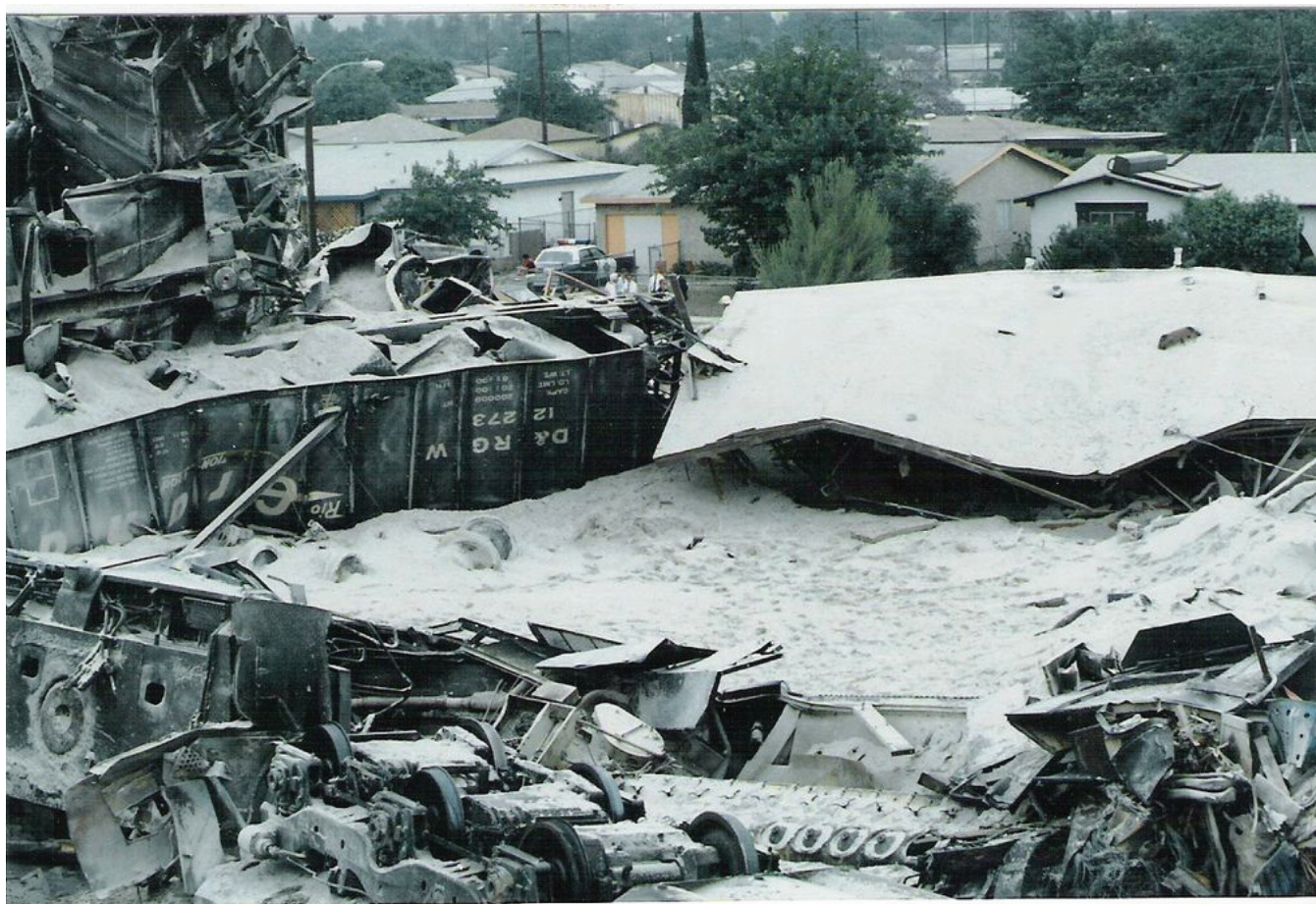
Сн. 3 Разрушени къщи, вследствие на инцидента

позволява тяхната по-нататъшна експлоатация, затова те са изтеглени, за да бъдат отремонтирани и възстановени.