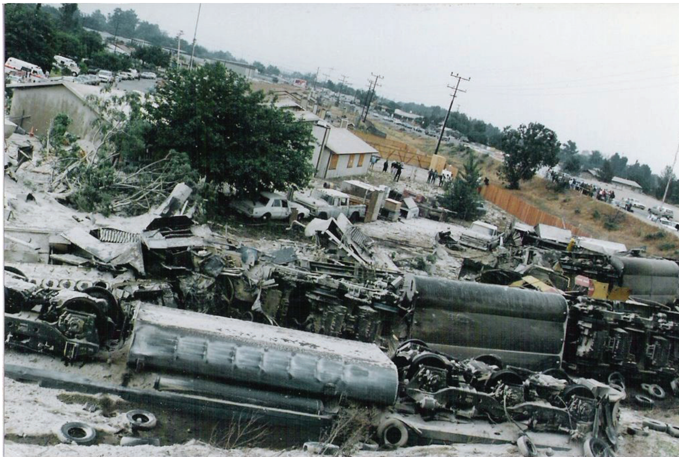
Сн. 2 Локомотивите

не на тръбопровода и пускането му в действие започва разчистването на останките от жп-композицията. Извършена е оценка на състоянието на съставните елементи на унищожената жп-композиция, като впоследствие 4-те водещи локомотива и 69-те товарни вагона са нарязани за скрап на мястото на произшествието. Първи от мястото на произшествието са отстранени останките на товарните вагони, което отнема два дни. На 15 май са премахнати основните локомотиви. Дерайлирали и повредени са и двата помощни локомотива, но състоянието им