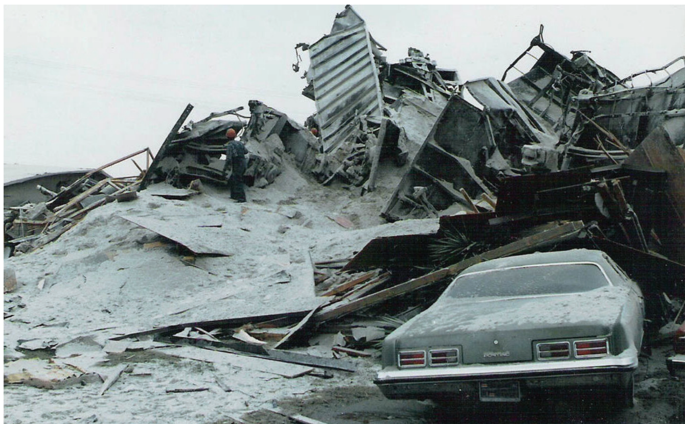
Сн. 4 Разрушени къщи, вследствие на инцидента

- липсата на ясен регламент за попълване на транспортните документи при товаренето на жп-вагоните, е причина отговорните служители да правят предположения и да допускат грешки при отчитането и регистрирането на точните количества превозвани товари. При натоварване на композицията