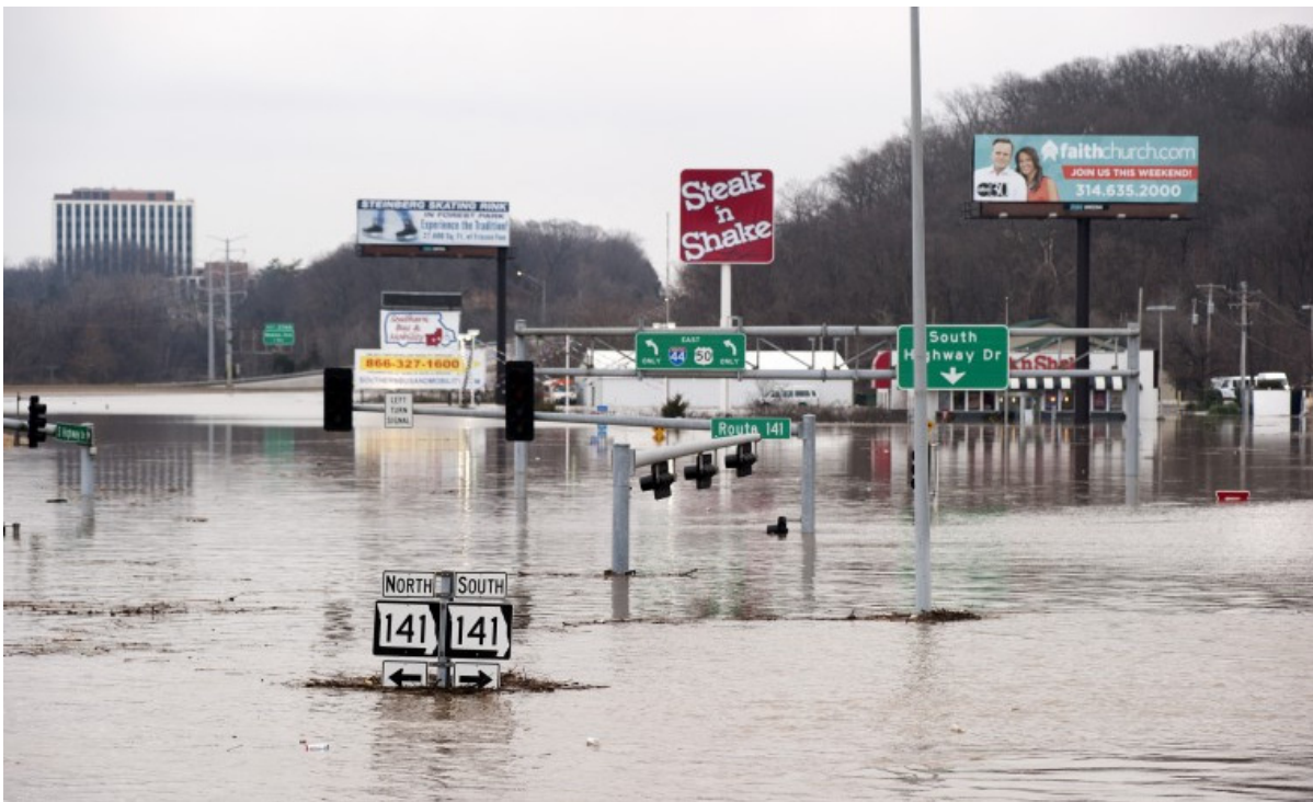
Фиг.4 Главен път в центъра на гр. Валеј парк изцяло под вода.