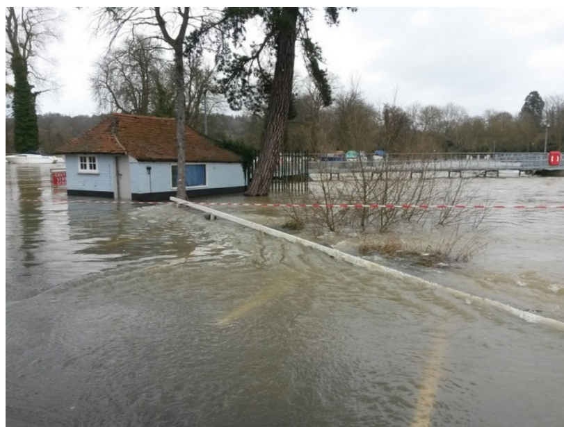
Фиг.3 Град Пангбърн под вода.