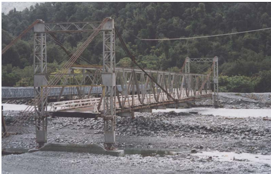
Фиг.2 Състоянието на речното корито в близост до стар мост над р. Грей дни преди наводнението.