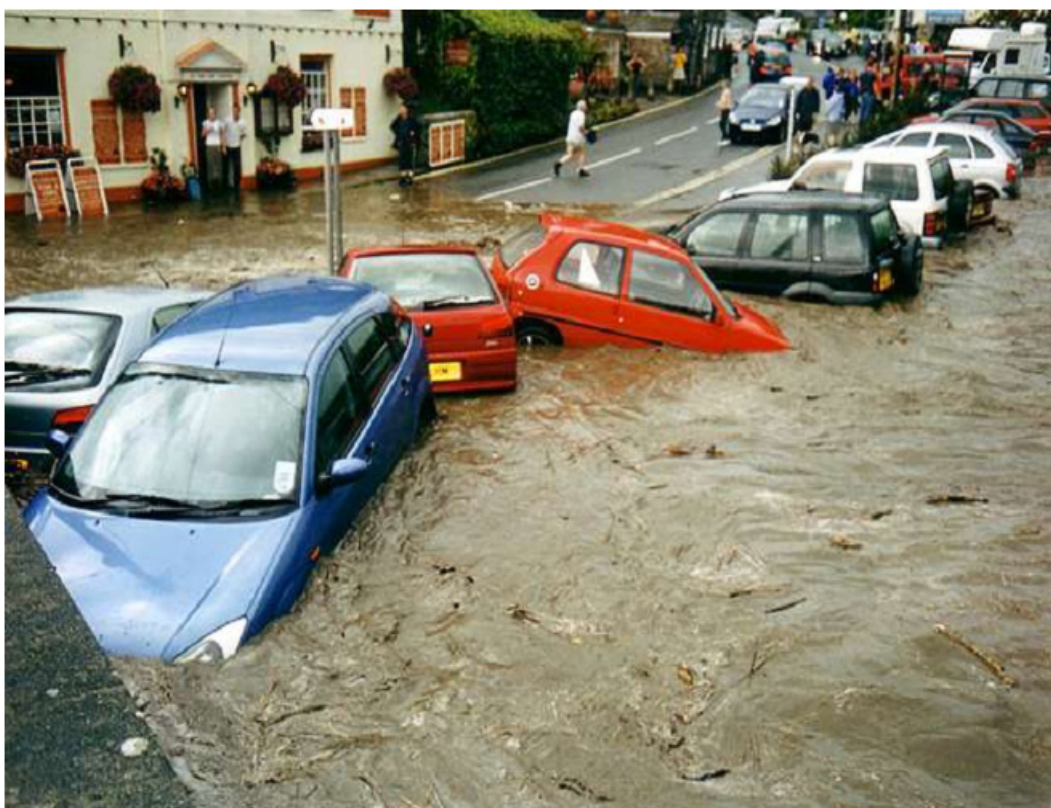
Фиг.1 Превозни средства отнесени от придошлите води на р. Валенси.