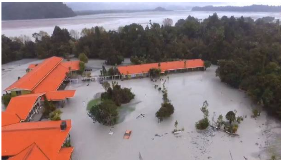
Фиг.5 Наводнени хотели и жилищни сгради във Франц Джоузеф Глейшер.